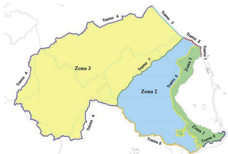
Fig. 1 Zonas incluidas en el ámbito de aplicación de la Ley 1/2018

El ámbito territorial de la Estrategia se inscribe en el área de influencia continental y marina de la laguna del Mar Menor, e incluye territorio de diez municipios: San Pedro del Pinatar, San Javier, Los Alcázares, Torre Pacheco, Fuente Álamo, Cartagena, La Unión, Murcia, Alhama de Murcia y Mazarrón, coincidiendo en buena parte con la delimitación establecida para el ámbito de aplicación de la Ley 1/2018, de 7 de febrero, de medidas urgentes para garantizar la sostenibilidad ambiental en el entorno del Mar Menor (Figura 1)